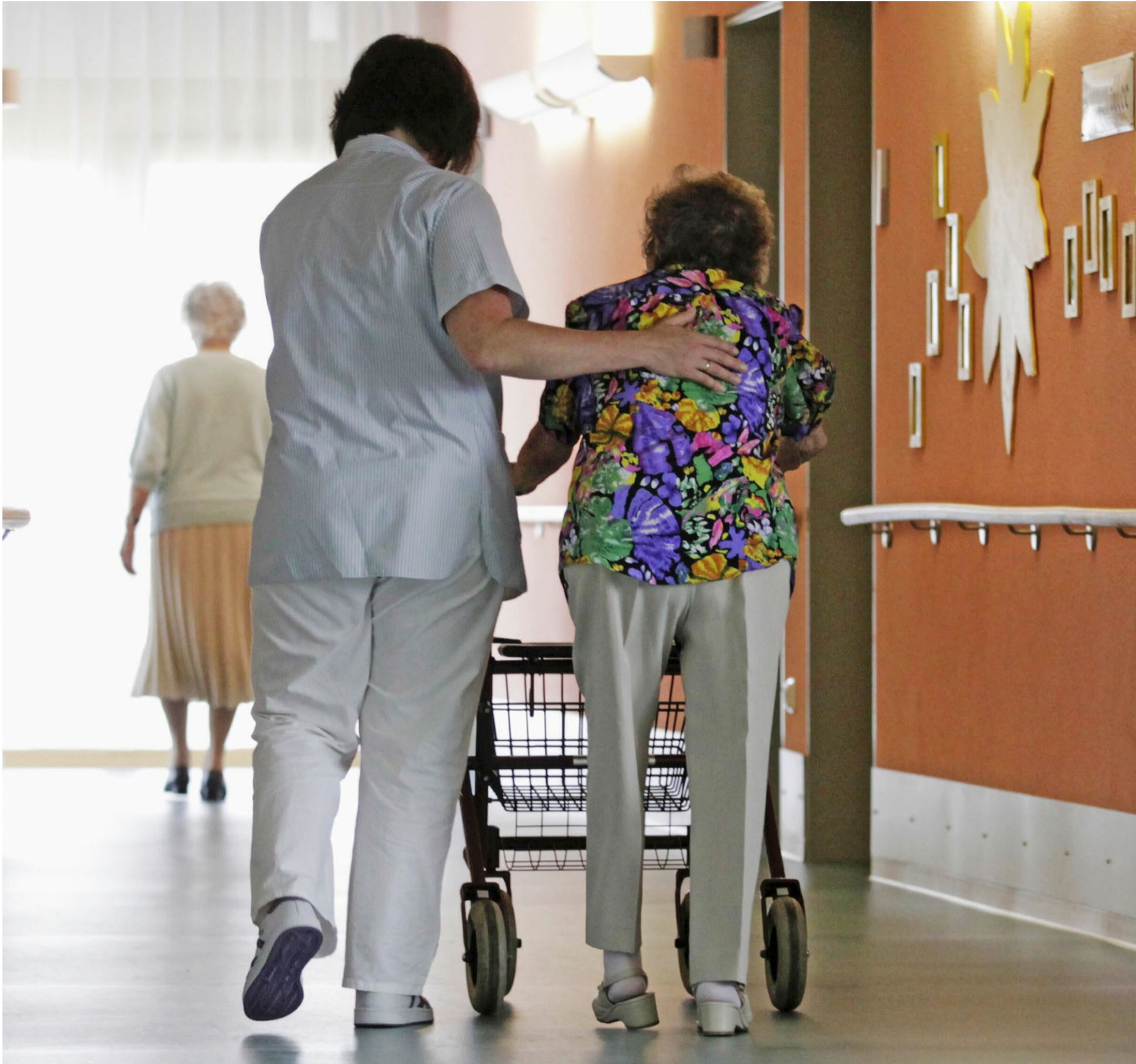
Eine betagte Frau wird von einer Pflegerin umsorgt: In Hunderten von Heimen in der Schweiz sieht die Realität anders aus